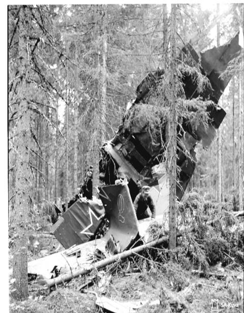
Останки штурмовика Ил-2