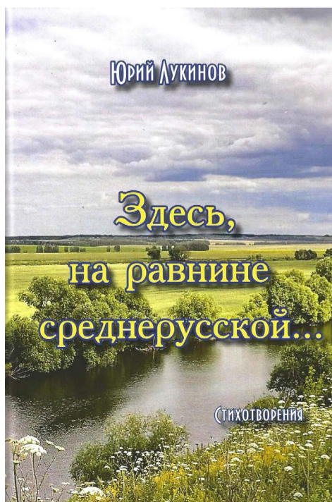
Издательство «Серебро Слов», Коломна, отпечатано в «АО Т8 Издательские технологии», Москва, 2019.-104., 500 экз.