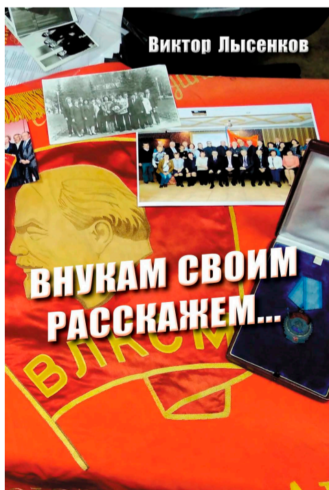
Рассказ о воскресенских комсомольцах разных поколений. Издание богато иллюстрировано архивными фотографиями. Издано при поддержке администрации района.